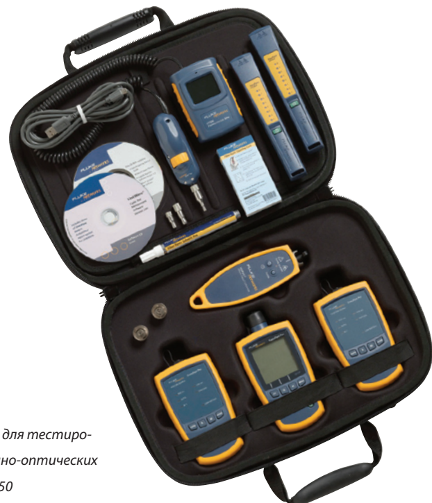
Полный набор для тестирования волоконно-оптических кабелей FKT1450